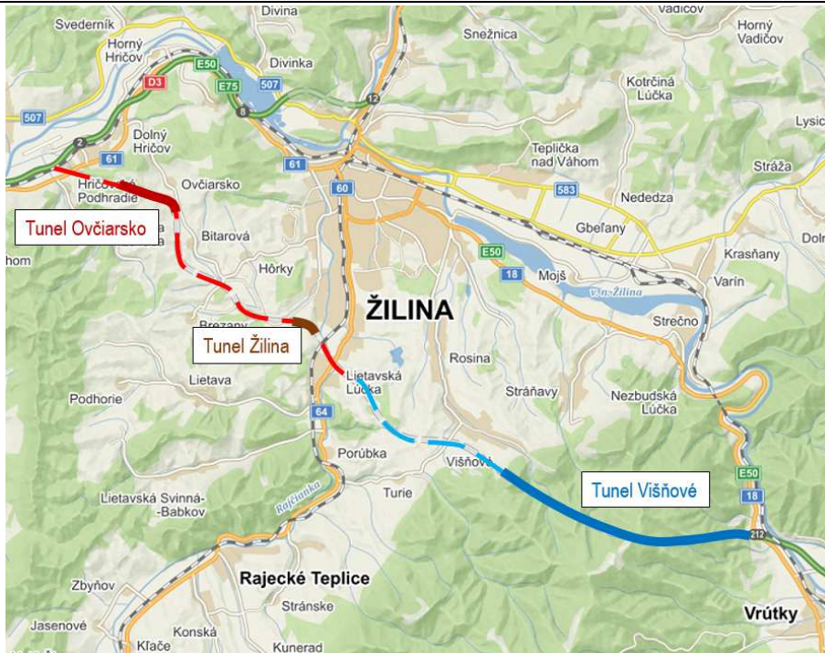
Obrázok 1: Schéma dvoch úsekov D1 Hričovské Podhradie – Lietavská Lúčka – Dubná Skala

Regiónom severného Slovenska medzi Žilinou a Martinom dnes vedie cesta I/18. Celoštátne sčítanie dopravy na tomto úseku z roku 2015 nameralo 30 tisíc vozidiel denne, z toho 25 % tvorí nákladná doprava. Ide teda o vysoko vyťažený koridor. Jeho súčasťou je prechod cez Malú Fatru obsahujúci meandre, kvôli ktorým je prechod dlhý a pomalý. Na úseku sa pravidelne tvoria zápchy. Silný tranzit cez Žilinu po vnútornom okruhu I/60 spôsobuje dopravný kolaps a tým zvyšuje nepohodlie obyvateľov.