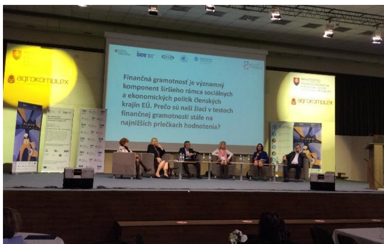
Legenda: panelová diskusia v rámci konferencie: „Inovácie v odbornom vzdelávaní“ na tému „Finančná gramotnosť a podnikateľské vzdelávanie na školách dnes. Ako ďalej?“, 05. 11. 2019

Účasť prispela k zvyšovaniu povedomia o potrebe chrániť finančné záujmy EÚ na Slovensku, čo je hlavnou úlohou odboru Centrálny kontaktný útvar pre OLAF na Úrade vlády SR v zmysle schválenej Národnej stratégie ochrany finančných záujmov EÚ v Slovenskej republike.