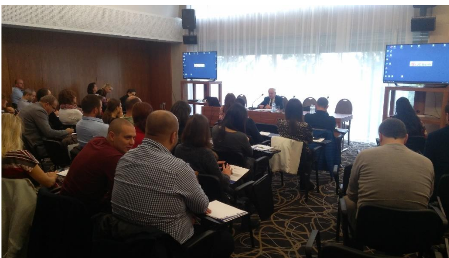
Legenda: Seminár: Ochrana finančných záujmov EÚ v podmienkach SR z pohľadu trestného práva, dňa 29. 10. 2019