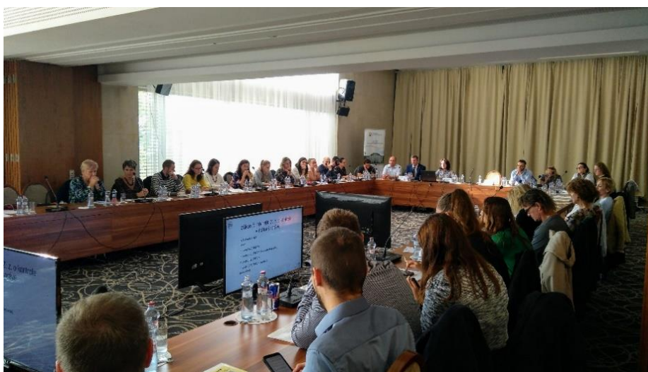
Legenda: Seminár: Ochrana finančných záujmov EÚ v SR, dňa 22. 10. 2019